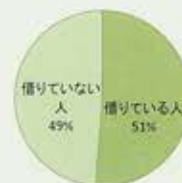
奨学金利用者の割合